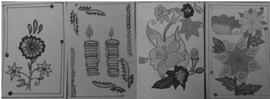
Zeichnungen der Grusskarten von den Internatsschulkindern

Erfreulicherweise konnte HSP ab Juli 2020 unter strengsten Vorschriften schrittweise die Kinder zurück in ihre Internate und Heime aufnehmen. Mittlerweile sind alle 196 Kinder und Jugendliche zurück. Traurig ist, dass einige dieser Kinder wegen Fehlen der Transportwege ihre Familien seit über 1 Jahr nicht mehr gesehen haben. Doch das Heim bietet ihnen Schutz und eine gesicherte Versorgung. Einzig im Rahmen der Internate und Heime konnte der „quasi reguläre“ Schulbetrieb im Juli 2021 wieder aufgenommen werden.