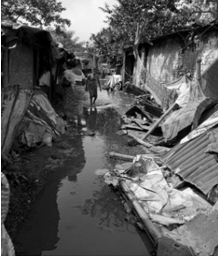
Von SMCS aufgesuchten Slums

Auch 2021 gab es erneut einen heftigen Zyklon im Mai, doch Yaas schädigte Howrah glücklicherweise kaum. Hingegen ist der diesjährige Monsunregen aussergewöhnlich langandauernd und heftiger als gewohnt.