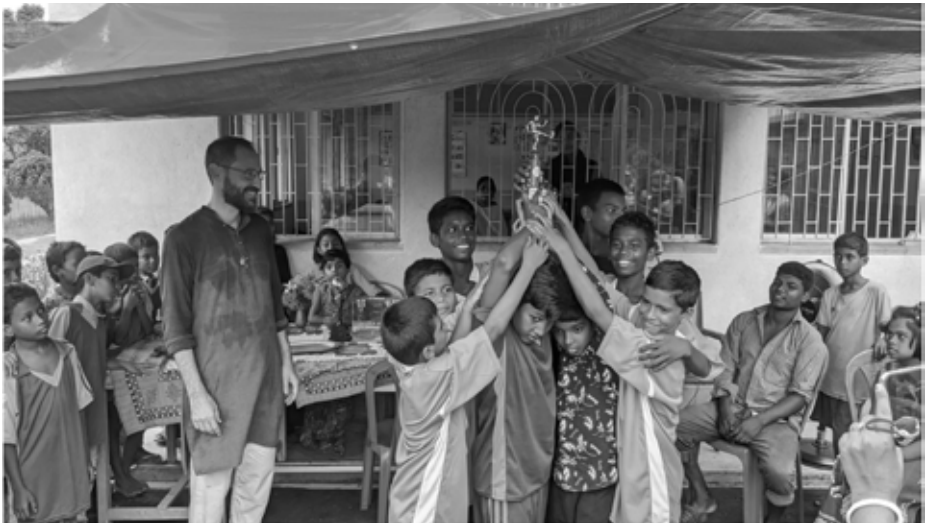
Siegerehrung in neuen Fussballtricot - ein Höhepunkt!