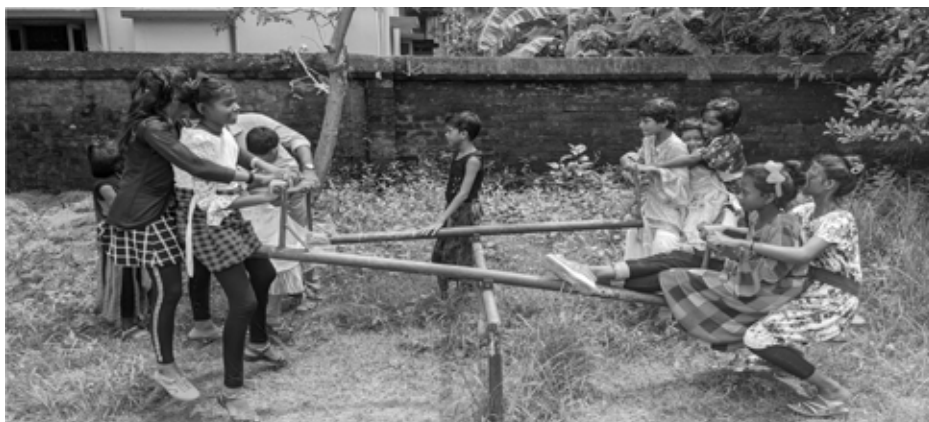
Pause in kleinem Rahmen