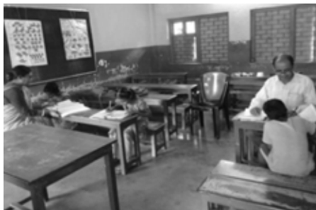
Unterricht mit Abstand für die wenigen Schulinternatskinder

In Indien begann das Jahr 2021 fast euphorisch mit Aufhebung vieler Einschränkungen. Im April 2021 jedoch schlug vor Ort die 2. Pandemiewelle ein. Die bereits schon geschwächten Familien wurden mit voller Wucht getroffen: Diese erneute Stilllegung des öffentlichen Lebens bedeutet für die meisten Tagelöhner, Kleintransporteure und Gelegenheitsarbeiter keine Arbeit und existentielle Not.